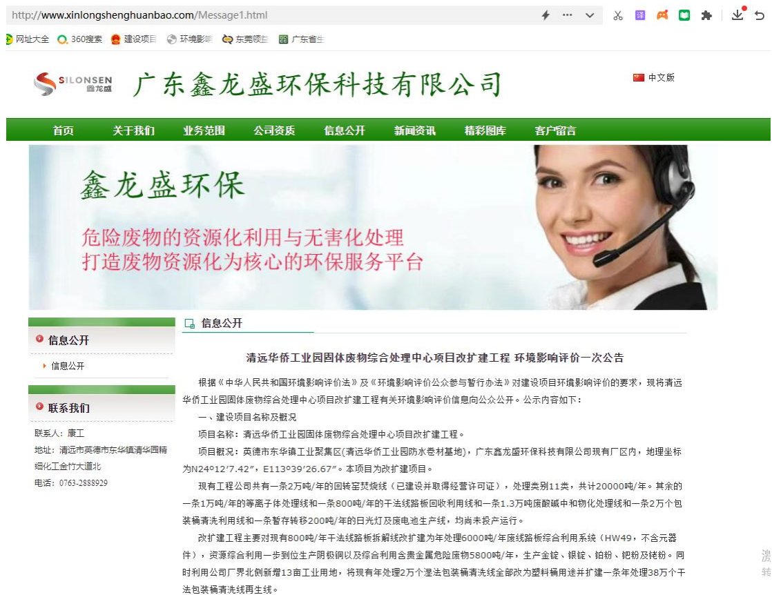
图 4.1-1 本项目首次环境影响评价信息公示