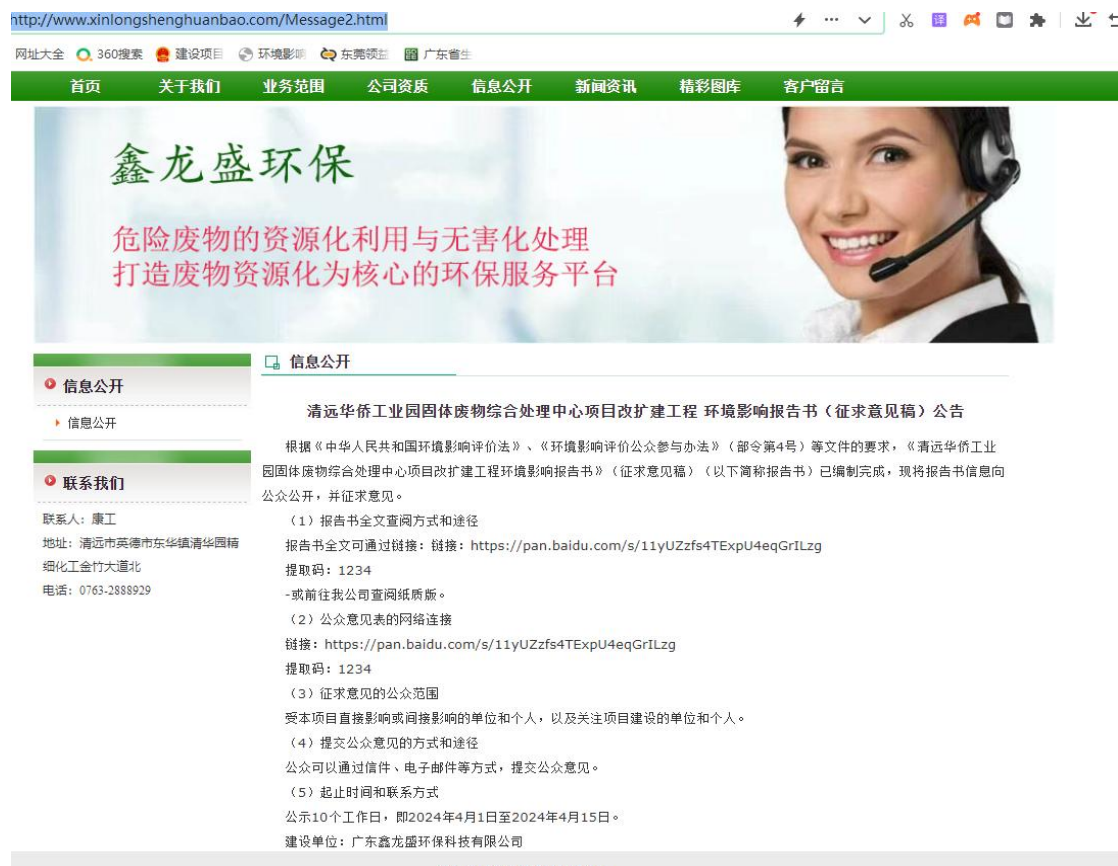
图 5.2-1 征求意见稿网络公示截图